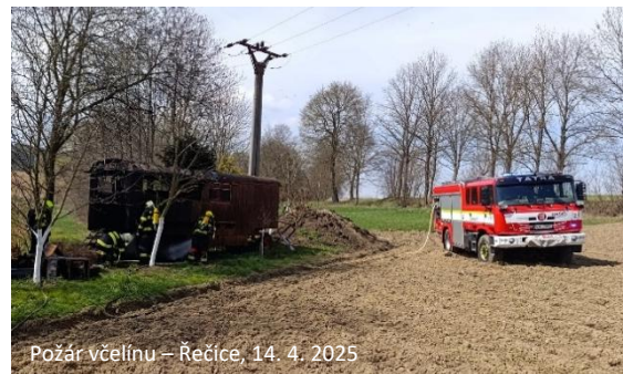
Požár včelínu – Řečice, 14. 4. 2025

roce 11. Mezi ty větší patří požár v kotelně rodinného domu v Křídlech 11. 1. 2025, dva požáry suché trávy v Bobrové 4. 3. 2025 a 21. 3. 2025, požár včelínu v Řečici 14. 4. 2025, požár pyrotechniky ve Zvoli nad Pernštejnem 1. 7. 2025, požár pole s obilím v Bobrůvce 5. 7. 2025, požár traktoru a pole v Nové Vsi u Nového Města na Moravě 13. 8. 2025 a požár suché trávy v Radkově 18. 8. 2025.