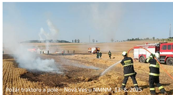
Požár traktoru a pole – Nová Ves u NMNM, 13. 8. 2025

V rámci výcviku se jednotka zúčastnila 22. 2. 2025 výcviku s dýchací technikou v polygonu na stanici HZR ČR ve Žďáře nad Sázavou a 26. 9. 2025 taktického cvičení okrsku v Bobrůvce (pátrání po pohřešované osobě). Pro mladé hasiče byl 25. 6. 2025 zorganizován výcvik hašení lesních požárů.