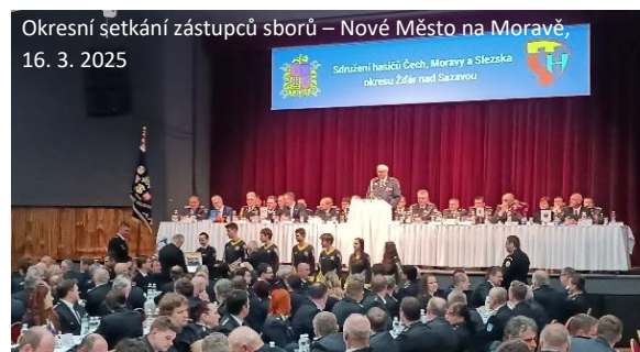
Okresní setkání zástupců sborů – Nové Město na Moravě, 16. 3. 2025