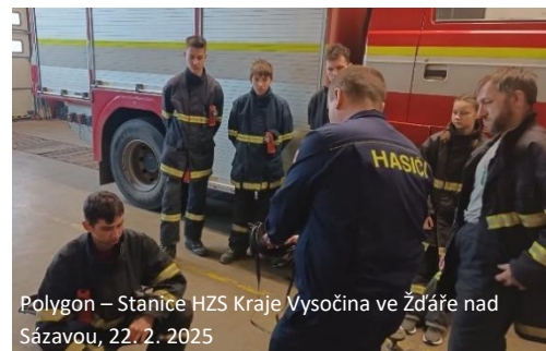
Polygon – Stanice HZS Kraje Vysočina ve Žďáře nad Sázavou, 22. 2. 2025

Jednotka SDH Bobrová plní stále úkoly jednotky také v obcích Mirošov a Račice.