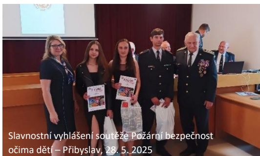
Slavnostní vyhlášení soutěže Požární bezpečnost očima dětí – Přibyslav, 28. 5. 2025

Na okresním shromáždění představitelů sborů dobrovolných hasičů, které se konalo 16. 3. 2025 v kulturním domě v Novém Městě na Moravě, bylo oceněno také naše družstvo dorostu, které se 6. 4. 2024 ve Vlašimi stalo mistry republiky v závodě hasičské všestrannosti a brannosti v kategorii smíšených družstev.