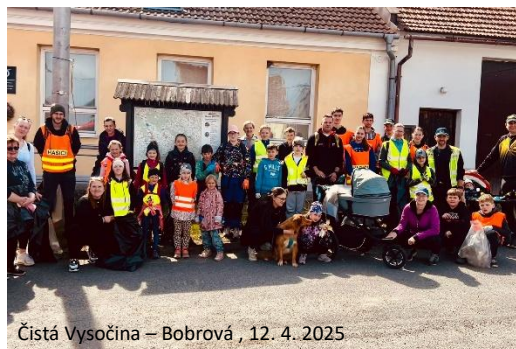
Čistá Vysočina – Bobrová , 12. 4. 2025

s lampionovým průvodem na téma pohádky O princezně Jasněnce a létajícím ševci