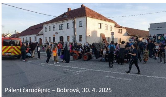
Pálení čarodějnic – Bobrová, 30. 4. 2025