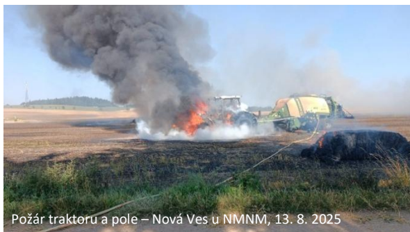
Požár traktoru a pole – Nová Ves u NMNM, 13. 8. 2025