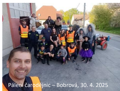
Pálení čarodějnic – Bobrová, 30. 4. 2025