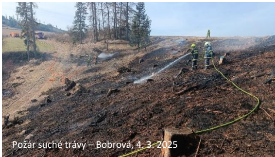
Požár suché trávy – Bobrová, 4. 3. 2025

V roce 2025 působilo v JSDH obce Bobrová 18 členů.