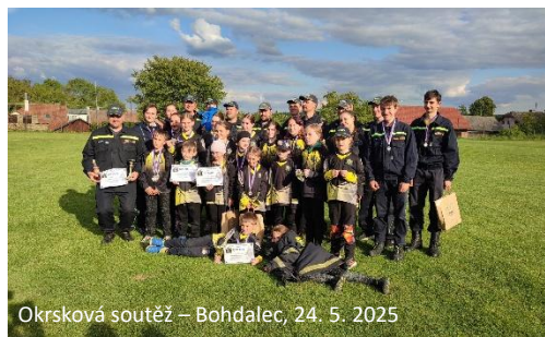
Okrsková soutěž – Bohdalec, 24. 5. 2025

11. 10. 2025 Podzimní kolo hry Plamen (ml. žáci – 12. místo, st. žáci – 19. místo) a Závod hasičské brannosti a všestrannosti v Újezdě (ml. žáci A – 15. místo, ml. žáci B – 15. místo, st. žáci - 13. místo, sm. dorost – 4. místo)