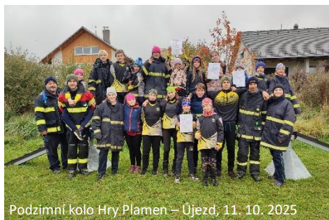
Podzimní kolo Hry Plamen – Újezd, 11. 10. 2025