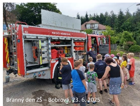
Branný den ZŠ – Bobrová, 23. 6. 2025

27. 6. 2025 Demontáž a vystěhování šatních kójí v ZŠ Bobrová